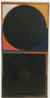
Syed Haider Raza (1922 Mandla district - 2016 New Delhi) Untitled 1986 Acrylic on paper 103.5 x 51 cm MAT.2011.14.1