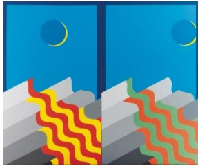
Mohammed Melehi (1936 Asilah - lives and works between Marrakesh and Tangier) Diptyque de Grenoble 1981 Acrylic on canvas 200 x 240 cm MAT.2007.1.316

This gallery brings together historical and contemporary works that see artist's systematically exploring the volume and density of space through fragmentation, modularity, and repetition in painting and sculpture, expressing perceptions on the intensity of life and enacting ways to make order of the world.