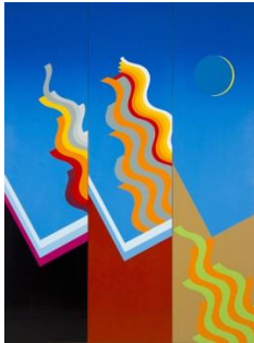
Mohammed Melehi (1936 Asilah - lives and works between Marrakesh and Tangier) Blue Moon 1984 Cellulosic paint on wood panel 199 x 148.5 cm MAT.2007.1.317

محمد المليحي ١٩٣٦ أصيلة - يقيم ويعمل بين مراكش وطنجة) اللوحة المزدوجة ١٩٨١ ألوان الأكريليك على قماش ٢٤٠ x ٢٠٠ سم MAT.2007.1.316